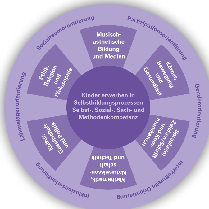
Grafik: Auszug aus dem Erfolgreich starten Leitlinien zum Bildungsauftrag in Kindertageseinrichtungen (S.24)

Um sich zu bilden, brauchen Kinder eine anregungsreiche Atmosphäre und Umgebung, die sie zu aktivem Handeln herausfordert, und Menschen, die gemeinsam mit ihnen forschen, gestalten und philosophieren. Indem sie in solch einem Rahmen Lösungen für Probleme in ihrem Alltag suchen, erwerben sie die unterschiedlichsten Fähigkeiten aus allen Bildungsbe- reichen, die in den Leitlinien zum Bildungsauftrag von Kindertageseinrichtungen des Landes Schleswig-Holstein beschrieben sind: